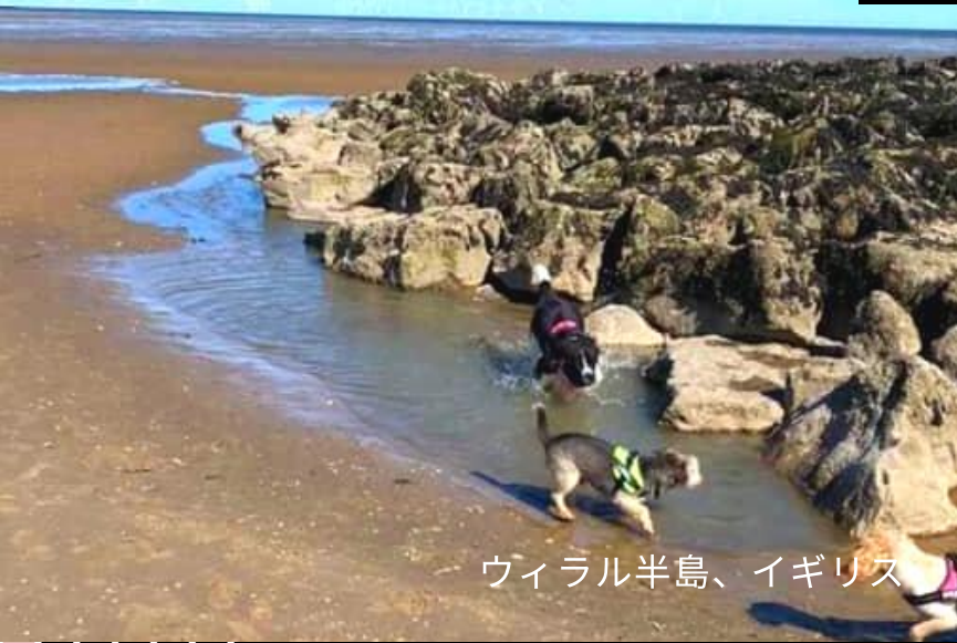
ウィラル半島、イギリス

INTRODUCING THE ASSISTANT LANGUAGE TEACHERS (ALTs) LIVING AND WORKING IN HAMAMATSU.