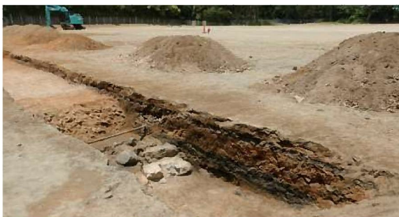
②お誕生場と二の丸の境界にある段差を確認 敷地の東西で段差があることを確認しました。 上段面がお誕生場、下段面が二の丸にあたと捉えられます。