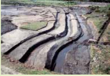
3重の環濠 東西120m、南北150mの規模で巡っています。伊場遺跡公園で一部再現されています。

伊場遺跡は、昭和29年に発見され、発掘調査が行われてきました。弥生時代後期の3重に巡らされた環濠とその周辺からは、多種多様な遺物が出土しています。