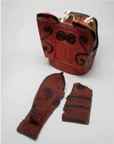
木製のよろい ※奥は復元品 背中側(左)と胸側(右)の破片