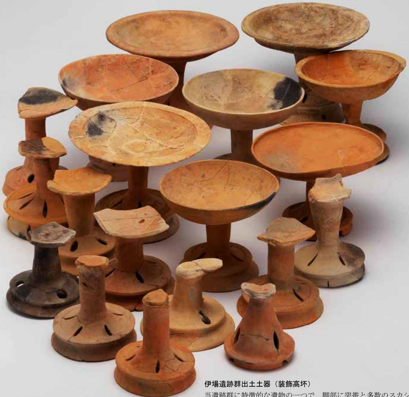
伊場遺跡群出土土器（装飾高坏）

当遺跡群に特徴的な遺物の一つで、脚部に突帯と多数のスカン孔を有します。木製高坏を模倣したものと考えられています。