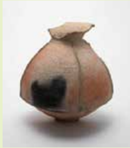
鱗付土器 縦方向の鱗状突帯がついています。