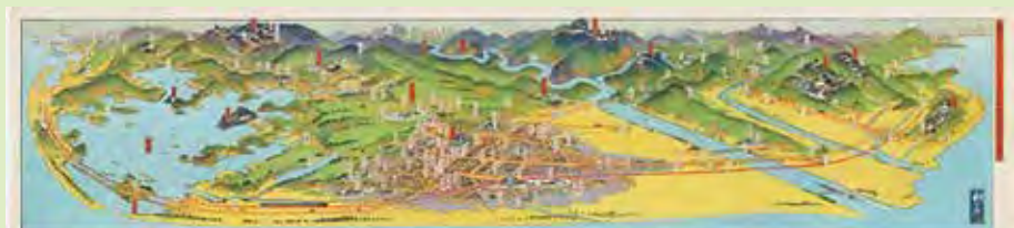
浜松市を中心とする名所史蹟交通鳥瞰図

「浜松市を中心とする名所史蹟交通鳥瞰図」では、表面には浜松の町名や工場、名所史蹟の場所、東海道線や遠州電気鉄道等の鉄道、裏面には市の概要や市内の名所史蹟の案内、名産品等が書かれています。