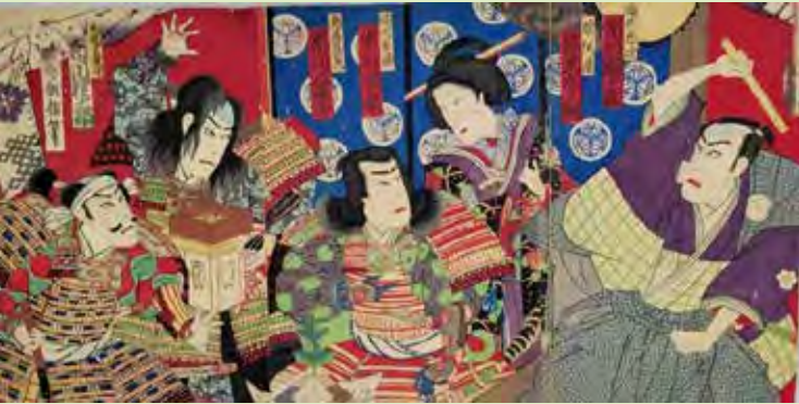
後風土記 酒井の太鼓

三方ヶ原の戦いについて直接示す資料は多くはありませんが、後に布陣図や錦絵などが描かれ、当時の様子や人物に対するイメージが形づくられていきました。