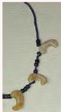
半田山古墳群出土のまが玉とガラス玉

ガラス玉をつくる 時には、鑄型に溶か したガラス玉を流 しこむ方法と、ガラスを溶かして棒のようなもの にし、さらにそれを溶かして針金状の棒に巻きつ け作る方法があります。博物館の体験イベントで は後者の方法でガラス玉づくりをします。