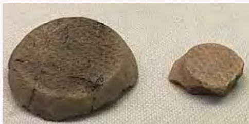
半場遺跡出土の土器の底部破片

縦と横を2本飛ばし、 交差しながら編む網 代編みのかごをつく ります。三内丸山遺跡（青森県）では、網代編み の縄文時代のかごが発見されています。 また、浜松では、蜷塚遺跡（中区蜷塚四丁目）や 半場遺跡（天竜区佐久間町半場）で、編み目跡の ついた縄文土器の底部の破片が見つかっていま す。これは、土器を作る時に編み目のあるものを 敷物として使用したため、ついた跡と考えられま す。