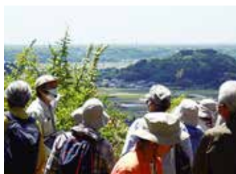
ハリさんぽ「井伊谷の城と館」

幅広い世代の方に文化財や歴史への興味を持っていただくために、地域の遺産を歩いて巡る「ハリさんぽ」、自転車で巡る「ちゃりさんぽ」をはじめ、さまざまなワークショップ、イベントなどを開催しています。