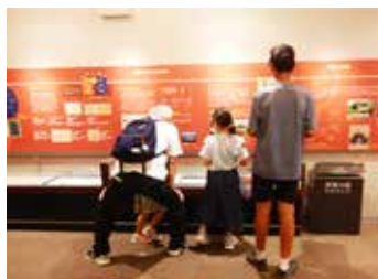
常設展「戦国の井伊谷」

センターがある井伊谷は、井伊氏のふるさとです。近くには、多くの名所・旧跡が存在しており、井伊谷や井伊氏に関する展示や、史跡についての情報を提供しています。ゆかりの地散策前に、ぜひお立ち寄りください。