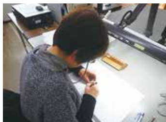
出土品の整理作業

地域遺産センターでは、市内の遺跡を発掘調査しています。出土品や調査の記録は、センターで整理・保管をしています。また、発掘現場での現地説明会、刊行物の発行など、発掘調査で得られた成果の公開を行っています。