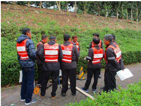
【機材の操作方法指導】