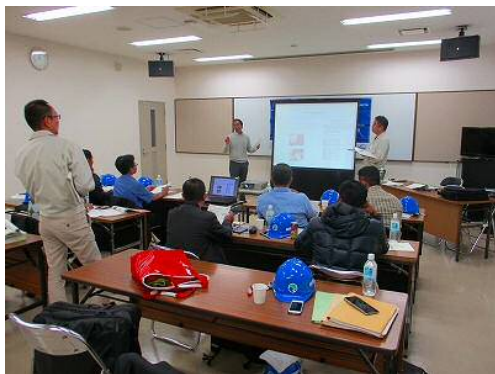
【給水工事施工マニュアル協議】