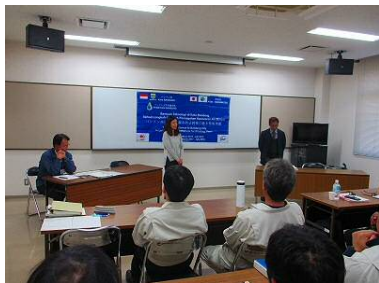
【浜松市職員コメント】