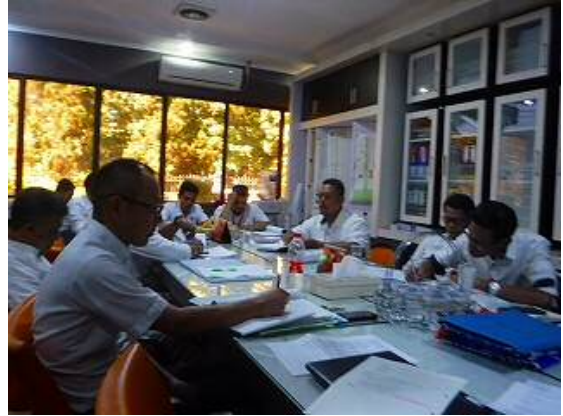
【ミーティング風景】