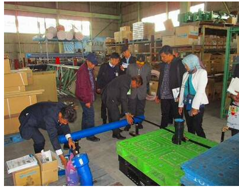
【市内商社：水道資材視察】