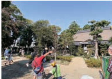
公民連携により整備された万斛庄屋公園

答弁 本市では、2年度に市民ワークショップを開催し、公園を使いこなすための方法を考え、「はままつ公園活用ガイドブック」を作成・公表した。また、5年4月には、民間事業者の資金とノウハウによる万斛庄屋公園建屋の整備が終了し、古民家レストランや住民活動スペースが生まれ、新たな公園利用が始ま