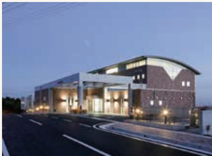
国民宿舎奥浜名湖

【答弁】平成30年度には約8万人の利用者数であったが、最も利用者が減った2年度・3年度には約4万人と、コロナ禍前の半数ほどにまで落ち込んだ。4年度には5万3000人と少し回復し、今年度は、直近10月の状況を見ると、コロナ禍前と変わらない利用者数にまで回復してきている。