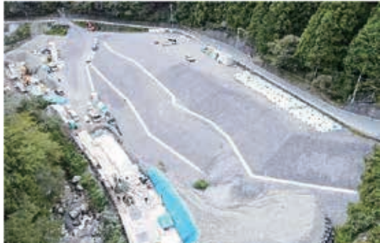
国道152号(池島・大原区間)第1工区