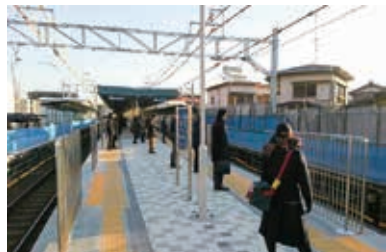
バリアフリー化を実施した浜北駅