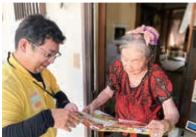
高齢者への配食サービスでメニューの説明を受ける利用者