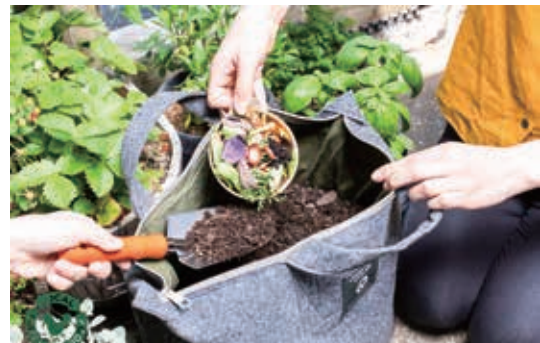
トートバック型コンポスト