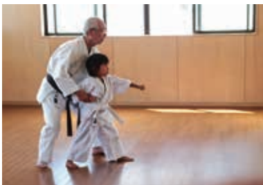
地域で空手を習っている子ども