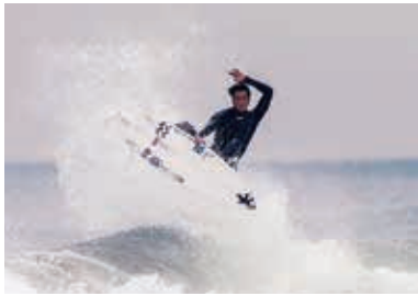
浜松の海で波に乗る三浦涼プロ