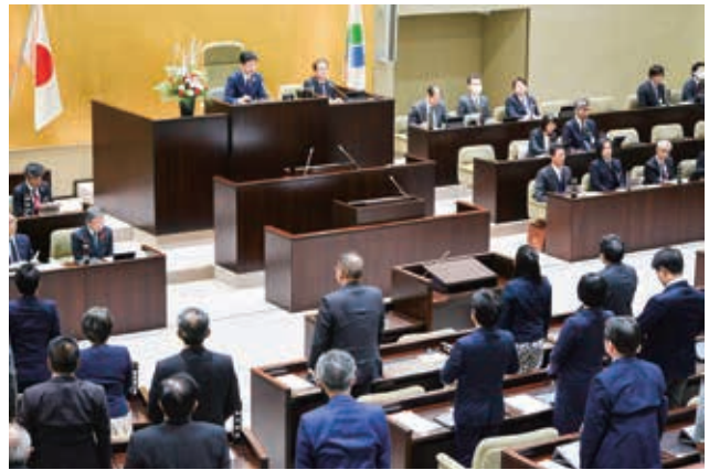
本会議での起立採決

また、人権擁護委員候補者の推薦案に同意したほか、区選挙管理委員及び区選挙管理委員補充員の選挙を行うとともに、議会提出議案として意見書4件を可決し、その実現を国に対して要望しました。