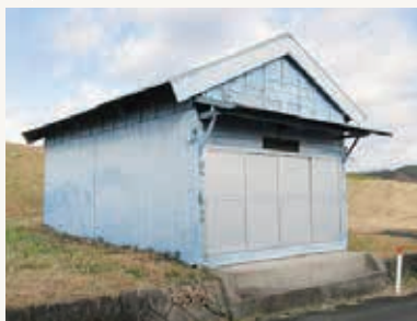
改築する上島分団水防倉庫

【答弁】上島分団は、天竜川で水防団が組織されているエリアの中の北端に位置しているが、当該水防倉庫は、水の流れるが速く水防の難所である水衝部に位置しており、河川の水位の上昇を監視する重要箇所であるため、同じ場所を改築するものである。なお、改築に当たっては、地元とも協議しながら進めている。