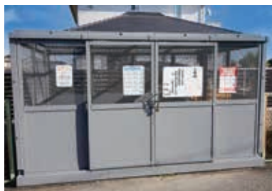
自治会が設置し管理するごみ集積所の例