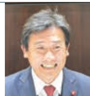
松本 康夫 自由民主党浜松