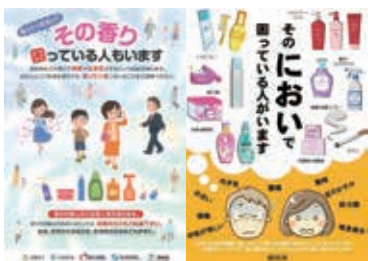
化学物質過敏症周知啓発ポスター