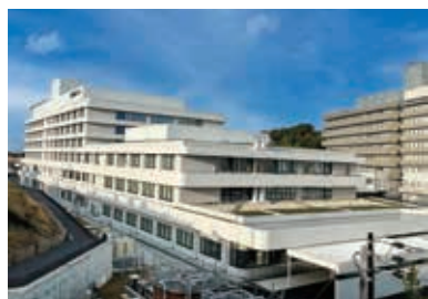
1月に開院した浜松医療センター新病院棟