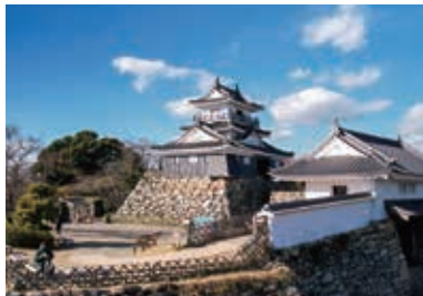
土塀の再建が期待される浜松城