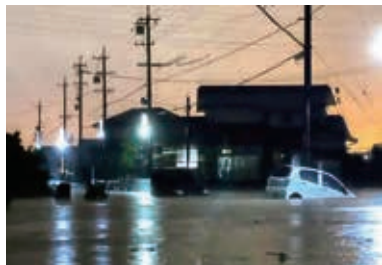
有隣川付近の浸水被害

具体的には、五反田 川との合流部における 河川形状の見直しと、 善願橋までの区間で河 道拡幅を計画しており、 計画がまとまり次第、