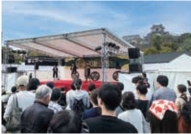
にぎわいを見せる浜松出世パークでの家康公祭り