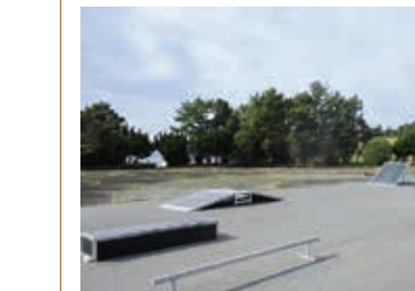
舞阪乙女園公園に整備されたスケートボードセクション