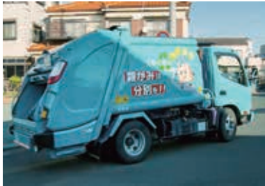
家庭ごみを収集するパッカー車