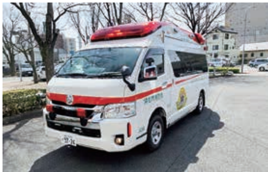
高規格救急自動車