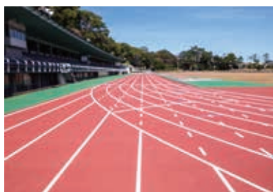
浜松シティマラソンなど様々な大会が開催される四ツ池公園陸上競技場