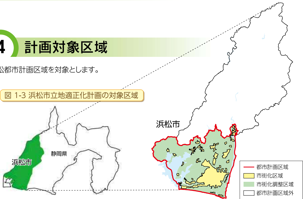
図 1-3 浜松市立地適正化計画の対象区域