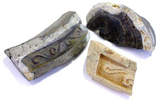
天守門より出土した軒丸、軒平瓦

基底部分からは門の基礎にした礎石が、石垣の上部から礎石や瓦が検出できたことから、天守門は二階建ての櫓門（やぐらもん）であることが確認できました。二階部分の櫓の大きさは、検出した礎石と出土した瓦の位置関係から想定して、幅 12m程度の規模であったと考えられます。櫓の両脇からは、塀に使用する塀瓦が集中的に出土しており、天守門は、土塀がめぐっていたことも併せて確認できました。櫓門に葺かれた瓦の特徴から、天守門は安土桃山時代（16世紀末）に建てられ、その後も江戸時代を通じて改修が繰り返されたと推定できます。天守門は城内でも一際大きな建物であり、天守閣が無くなった後は、浜松城の象徴的な存在として維持されたとみられます。