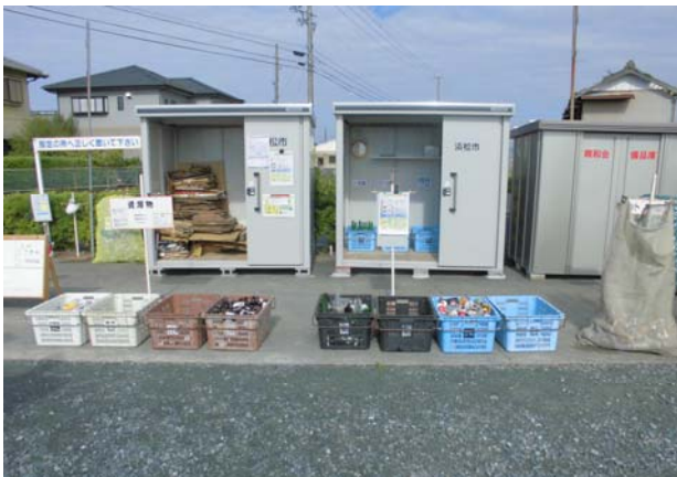
取材させていただいた日は、「資源の日」です

浜北区中瀬5区自治会では、「資源の日」「不燃の日」「特定品目の日」に、朝6時30分から8時30分までの間、環境美化推進員を中心に地域住民が一体となって正しい分別指導を行っています。また、ごみの減量・リサイクルのため、資源物回収保管庫を使用し、積極的に段ボールや雑誌、雑がみ、アルミなども回収しています。