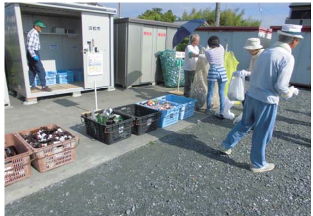
多くの住民のみなさんが、ごみ出しに来ていました