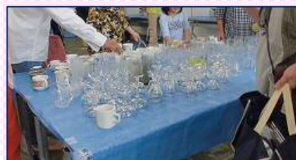
(↑→)6月のもったいない食器市の様子

もったいない食器市では、もったいない市と同様に不用になった食器を持ち込むことができます。