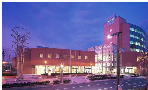
アクトシティ研修交流センター（ホームページより）