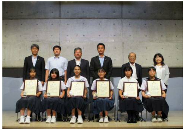
<大会出場者と審査委員の皆様>