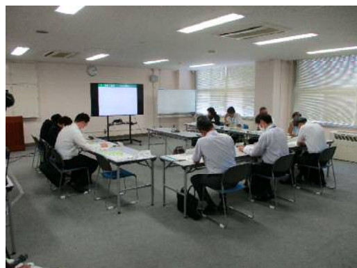
＜ 第1回協議会の様子 ＞

また、いじめ防止対策の向上を図るために、各機関間の連携を「見える化」し、つながりを明確にしていくことが確認されました。