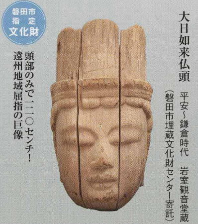
頭部のみで二〇センチ！ 遠州地域屈指の巨像