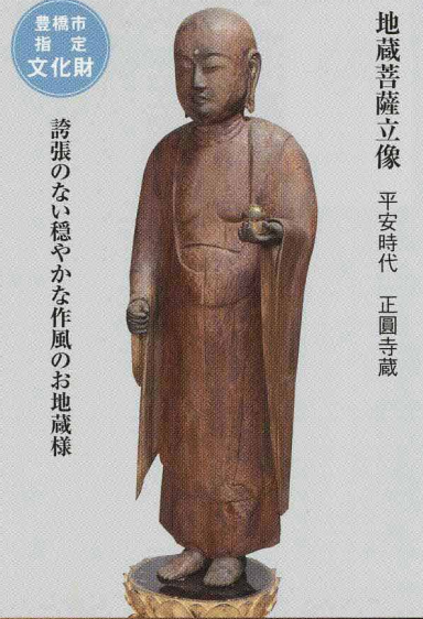
誇張のない穏やかな作風のお地藏様