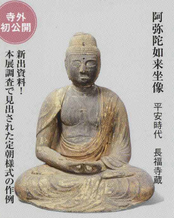
寺外初公開 本展調査で見出された定朝様式の作例

三遠国境の山岳周辺、浜名湖等の水辺周辺に栄えた遠州・三河の仏教文化圏。本展では、その繁栄の証といえる仏像(神像を含む)の中から、奈良・平安・鎌倉～江戸時代にさかのぼる「しられざる」作例を中心に展示し、この地域で栄えた仏教文化圏の様相に迫ります。