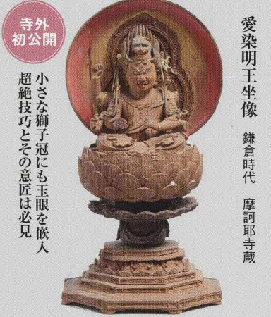
寺外初公開 小さな獅子冠にも玉眼を嵌入 超絶技巧とその意匠は必見