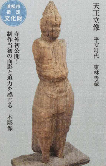
寺外初公開！ 制作当初の面影と迫力を感じる一木彫像