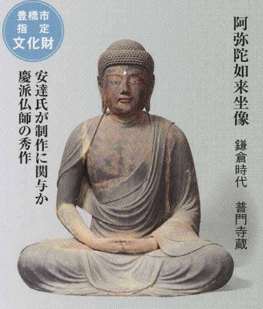
豊橋市定文化財 安達氏が制作に関与か 慶派仏師の秀作