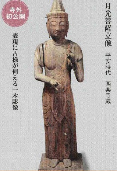
寺外初公開 表現に古様が伺える一木彫像