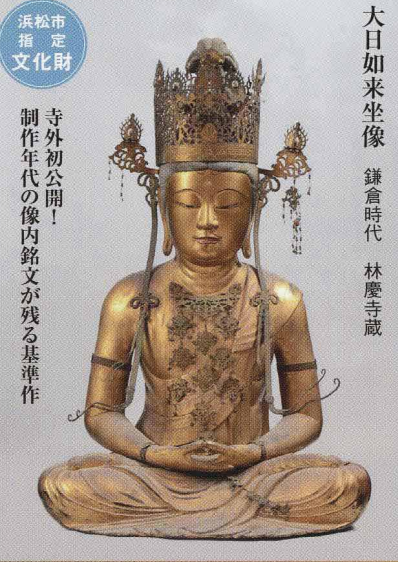
寺外初公開！ 制作年代の像内銘文が残る基準作