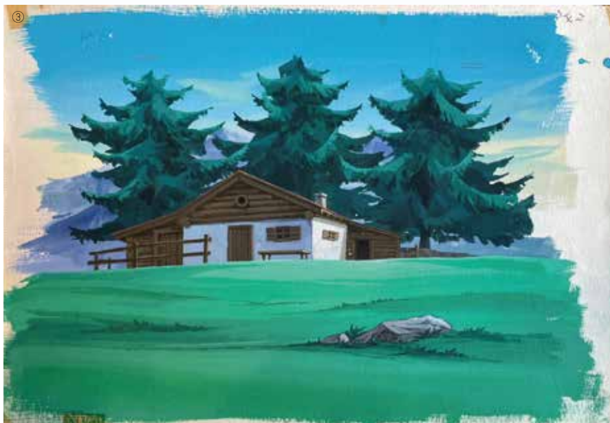
③『アルプスの少女ハイジ』背景画(1974年)個人蔵、④⑤おんじとベーターのキャラクターデザイン決定稿(小田部羊一画、1973年)作家蔵、⑥『アルプスの少女ハイジ』クララのセル画(1974年)個人蔵、⑦講談社『世界名作全集』第23巻『アルプスの少女』口絵原画(落谷虹児画、1952年)講談社蔵、⑧『ハイジ』原画(フレドリッヒ・フアィファア画、1880年)Heidi-Archiv, Heidisium Zürich蔵、⑨『アルプスの少女ハイジ』パイロットフィルム用のセル画+背景画(森やすじキャラクターデザイン、1973年)個人蔵。