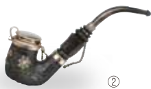
①アニメ『アルプスの少女ハイジ』オープニング原画(宮崎駿 1973年)個人蔵 ②『アルプスの少女ハイジ』の作画参考用にスイスで購入されたパイプ。個人蔵

スイス人作家ヨハンナ・シュピーリ原作の“ハイジ”は、約70の言語に翻訳され、世界中で愛されています。日本では、高畑勲、宮崎駿、小田部羊一ら、超一流のスタッフにより制作されたテレビアニメーション『アルプスの少女ハイジ』が広く知られています。本展では、“ハイジ”に関する貴重な実物資料を、文学からの視点(原作者直筆の手紙、原書・翻訳本掲載の挿絵・イラストの原画、世界各国の「ハイジ」の翻訳や映画作品等)、アニメーションからの視点(原画、レイアウト、絵コンテ、セル画、背景画等)で構成し、それぞれの視点から“ハイジ”の魅力を紹介します。