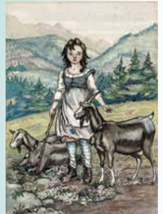
ローラ・アングラーダ画 1929年