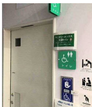
⑥バリアフリートイレ