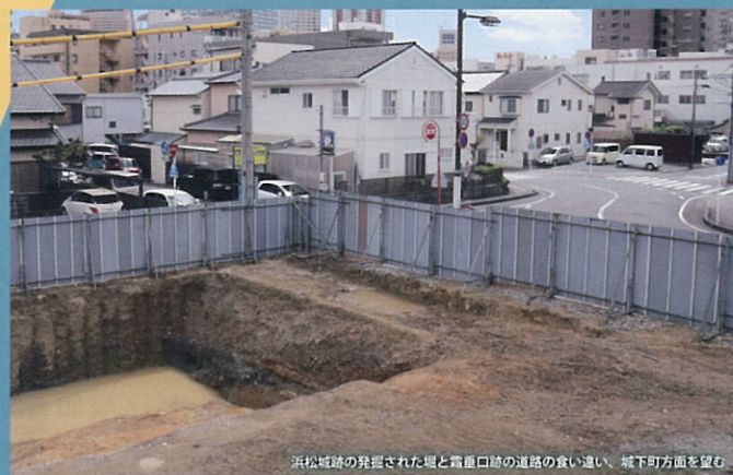
浜松城跡の発掘された堀と竈置口跡の道路の食い違い、城下町方面を望む