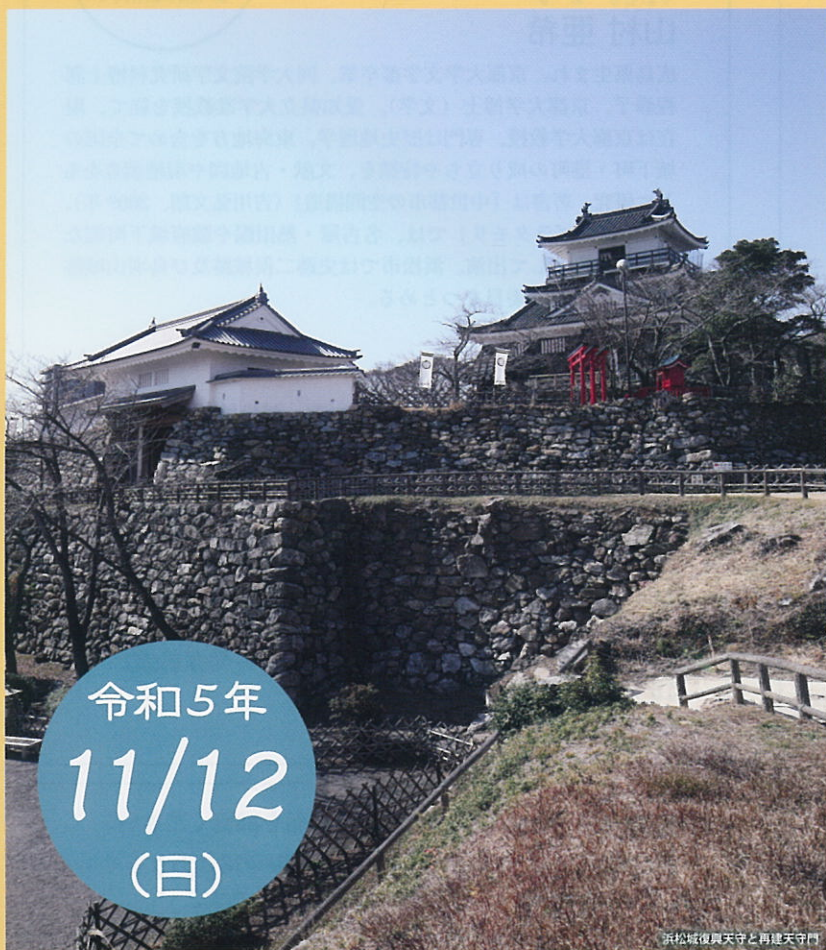
浜松城復興天守と再建天守門