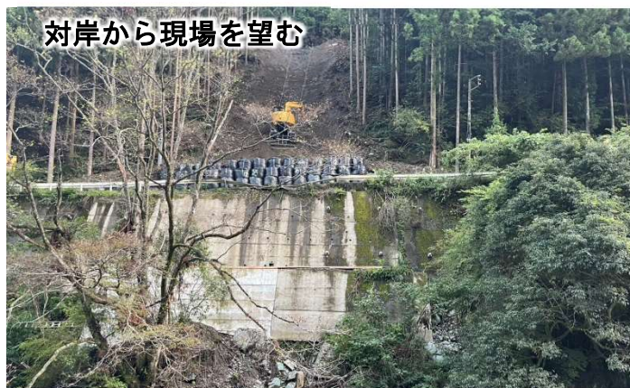
対岸から現場を望む