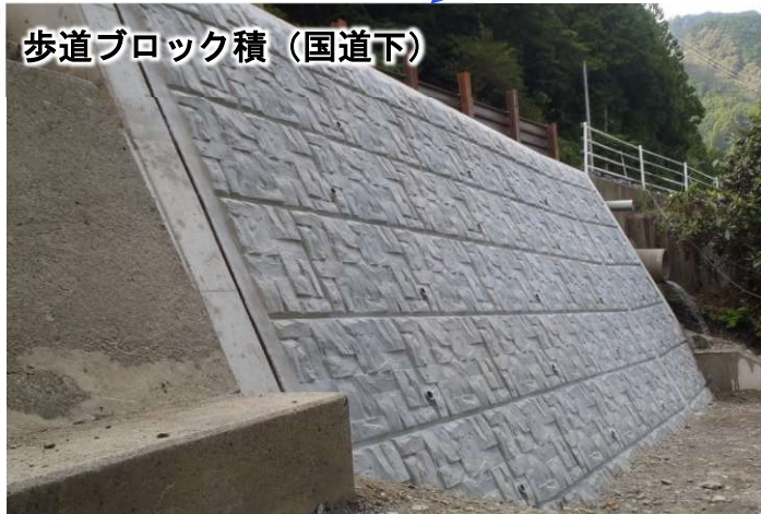
歩道ブロック積 (国道下)