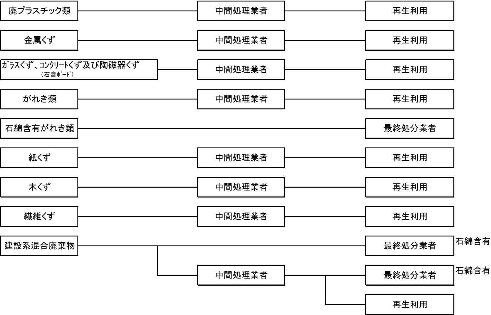
(別紙1)産業廃棄物の一連の処理工程