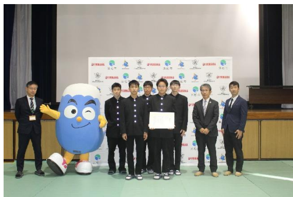
やらまいか賞 『静岡県教育委員会 高校教育課長賞』