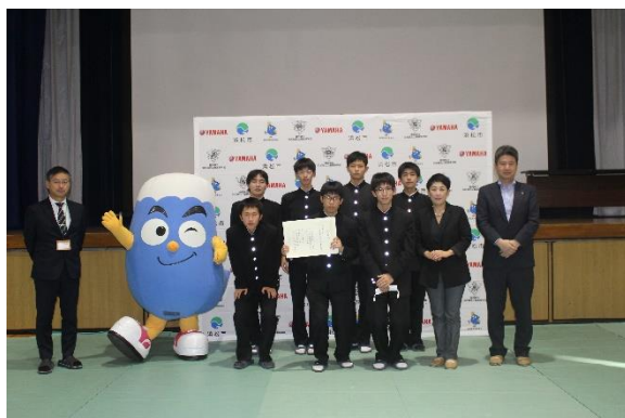
やらまいか賞 『ヤマハ発動機 ロボティクス事業部賞』