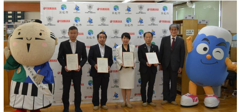
第1回マイスター・ハイスクール 運営委員会の様子