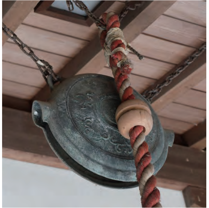
寺社の軒先に吊るされた鰐口

近代以前には多くの寺社の軒先に吊るされていましたが、 はいぶつきしやく 廃仏毀釈や戦争中の供出により数を減らしたと言われています。北海道と沖縄を除く全国に分布しており、浜松市内では文化財指定されたものだけでも18口が知られています。