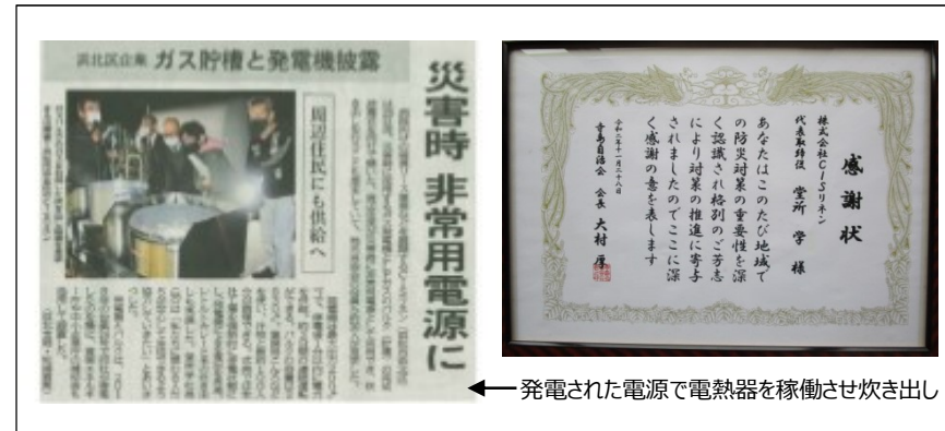
取り組みの報道と地元自治会からの感謝状